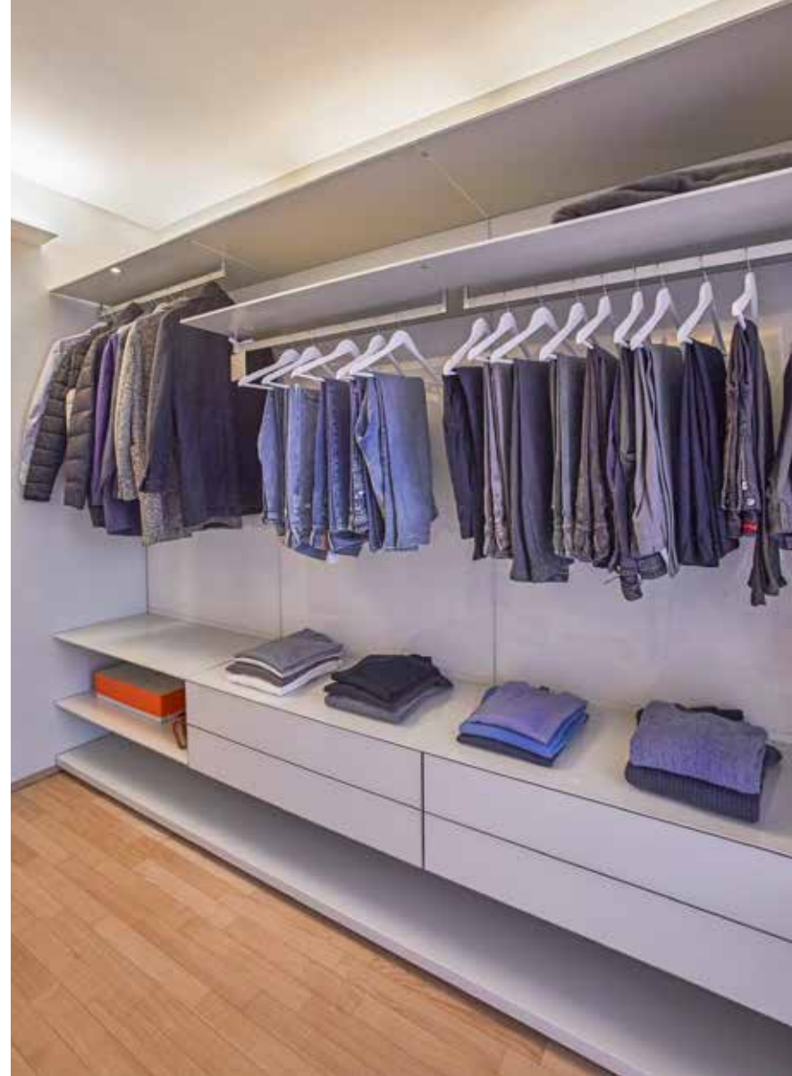
L'area padronale si articola tra la camera con letto Alf DaFré in tessuto grigio blu a doppio filo, la cabina armadio in vetro laccato lucido bianco di Rimadesio e il bagno privato, con arredo e rivestimento grigi. Di effetto scenografico la lampada Moon di Davide Groppi in carta giapponese, le lampade Neuro dei comodini e la carta da parati Wall&decò con decorazioni floreali (Prospektiv).