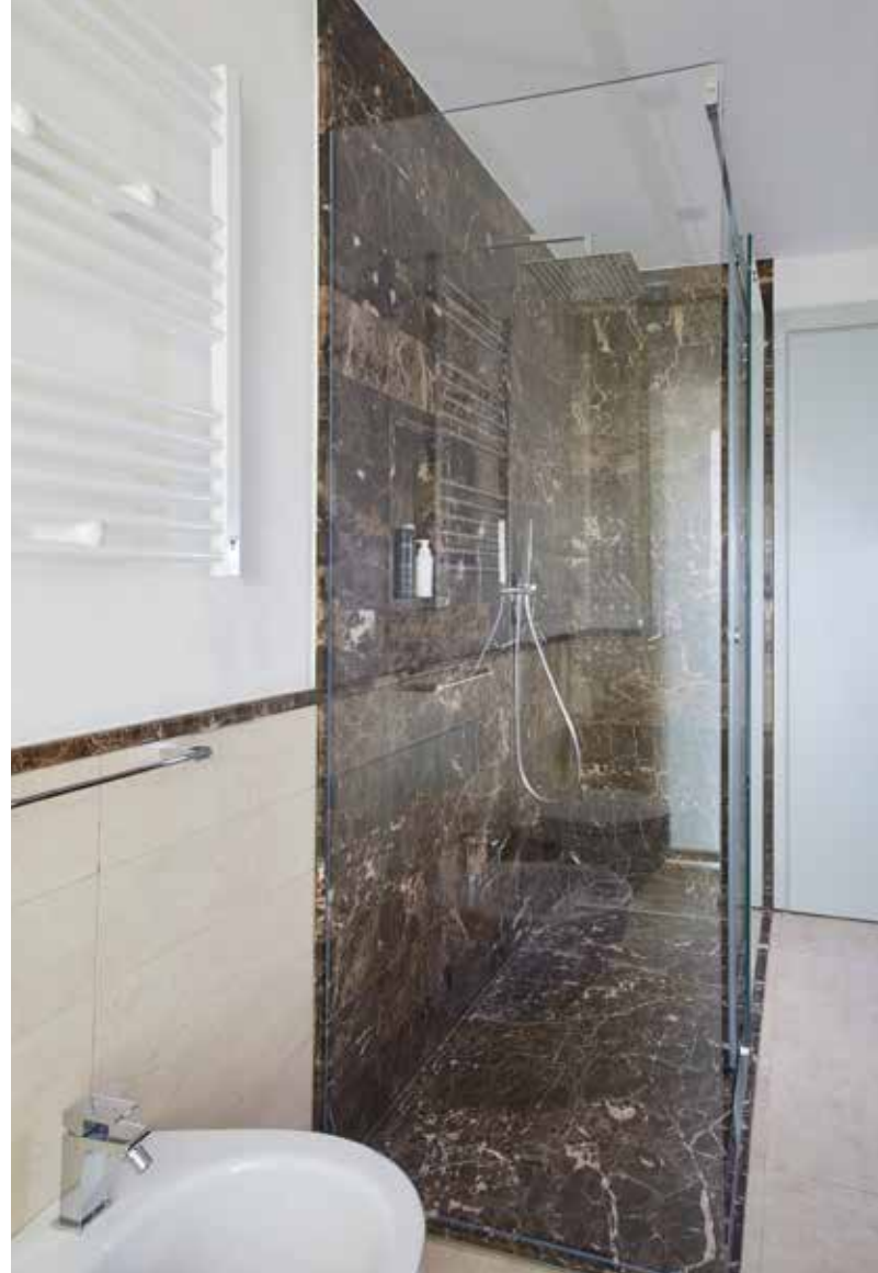
Scorci del bagno padronale e ospiti: entrambi moderni ed essenziali, mantengono le cromie grigie. Molto elegante la doccia in marmo Emperador.