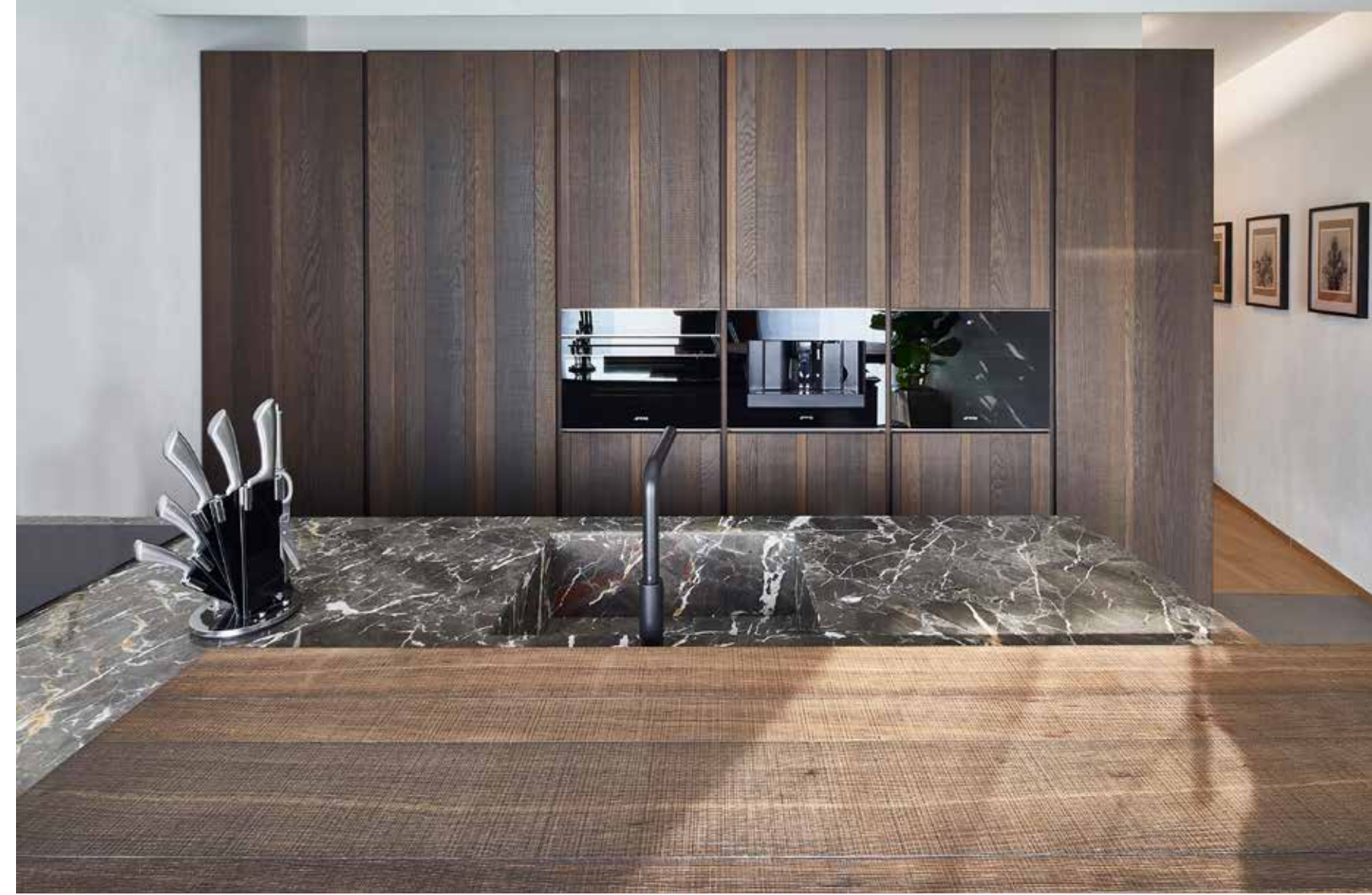
Inquadrature della cucina, realizzata dietro la quinta divisoria che la separa dal living: composizione a colonna in rovere termico vintage e isola centrale con piano in marmo grigio Tunisi e banco snack (Prospektiv). Pavimento in gres effetto cemento. Finitura rosso mattone della parete opposta, a richiamo delle venature del marmo. A sinistra: tra le due vetrate con vista sulla città, tavolo da pranzo Manta di Rimadesio, con piano in vetro trasparente grigio. Attorno, sedie in rovere e pelle nera Carl Hansen. Lampadario Nemo (Prospektiv).