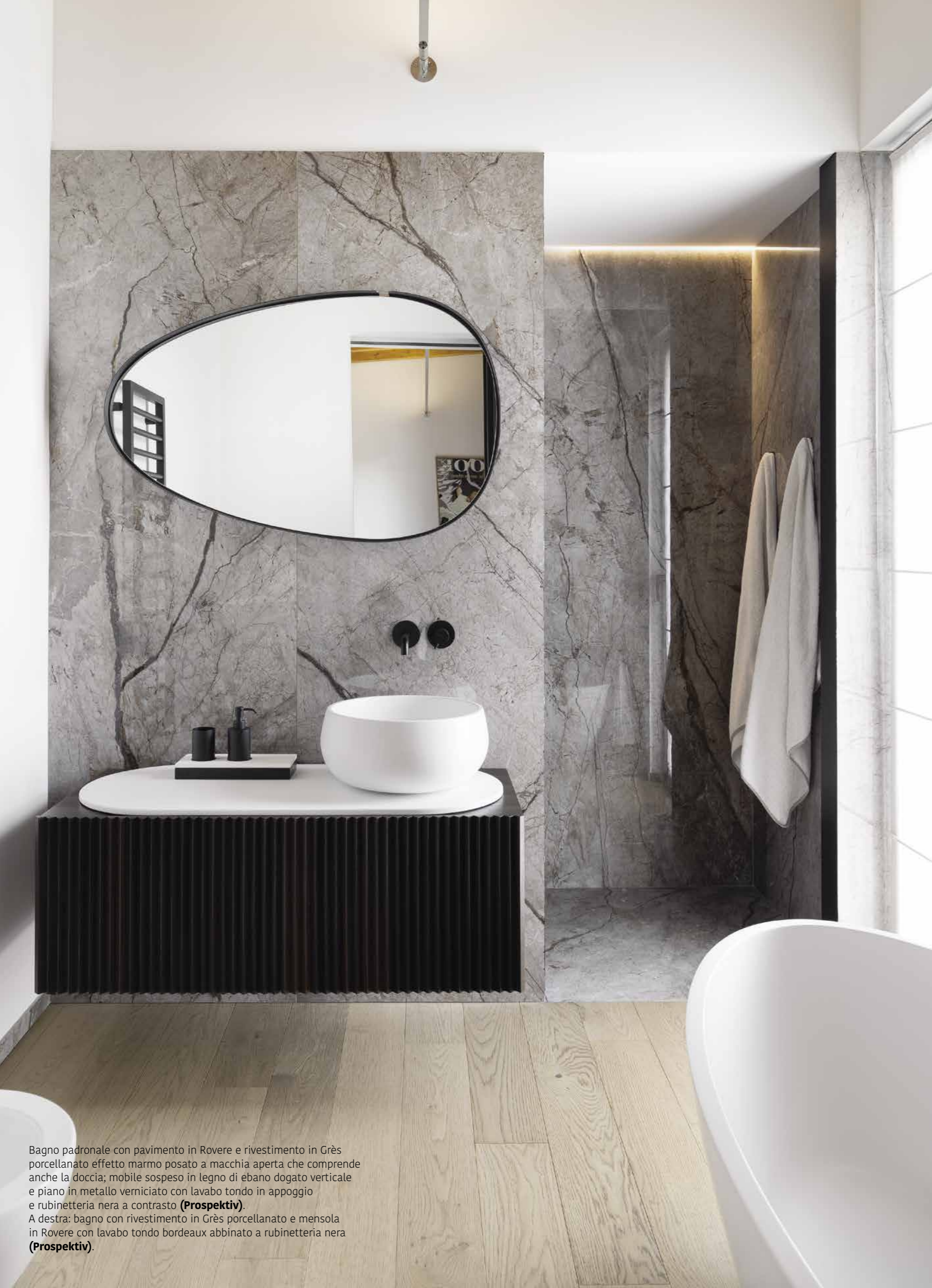
Bagno padronale con pavimento in Rovere e rivestimento in Grès porcellanato effetto marmo posato a macchia aperta che comprende anche la doccia; mobile sospeso in legno di ebano dogato verticale e piano in metallo verniciato con lavabo tondo in appoggio e rubinetteria nera a contrasto ( Prospektiv ). A destra: bagno con rivestimento in Grès porcellanato e mensola in Rovere con lavabo tondo bordeaux abbinato a rubinetteria nera ( Prospektiv ).